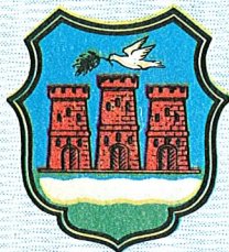
NOVI SAD 7. V 1975.