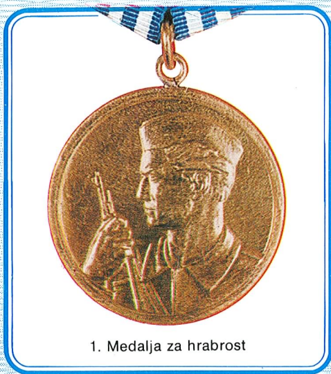
1. Medalja za hrabrost

Medalja za hrabrost dodjeljuje se pripadnicima oružanih snaga SFRJ koji su u borbi protiv neprijatelja izvršili jedno ili više djela u kojima je došla do izražaja njihova lična hrabrost. Za takva djela Medalja za hrabrost dodjeljuje se i građanskim licima.