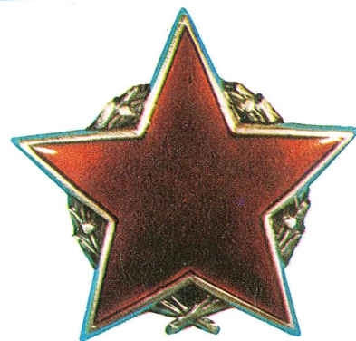
17. Orden partizanske zvijezde sa srebrnim vijencem

Ovaj orden dodjeljuje se i građanskim licima u jedinicama oružanih snaga SFRJ, kao i pojedincima u organizacijama udruženog rada i drugim organizacijama, koji svojim primjerom i umješnošću u radu razvijaju stalan polet i postižu izvanredne rezultate u ostvarivanju zadataka od posebnog neposrednog značaja za narodnu odbranu.