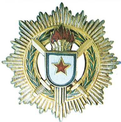
16. Orden za vojne zasluge sa velikom zvijezdom

Orden za vojne zasluge sa velikom zvijezdom dodjeljuje se rukovodiocima jedinica oružanih snaga Socijalističke Federativne Republike Jugoslavije koji svojim primjerom i umješnošću u radu razvijaju u jedinici kojom rukovode stalan polet radi ostvarenja postavljenih zadataka, ili koji su u jedinici ili ustanovi stvorili uslove za postizanje izuzetno dobrih uspjeha, ili koji se odlikuju takvim starješinskim i vojničkim osobinama da služe za primjer drugima.