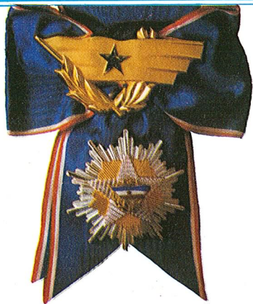
8. Orden jugoslovenske zastave sa lentom

Orden jugoslovenske zastave sa lentom dodjeljuje se za zasluge u razvijanju i učvršćivanju miroljubive saradnje i prijateljskih odnosa između Socijalističke Federativne Republike Jugoslavije i drugih država, kao i za naročite zasluge u radu na razvijanju svijesti građana u borbi za nezavisnost zemlje.