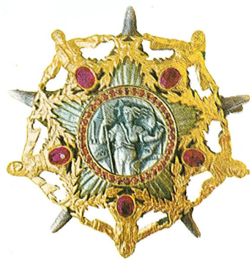
4. Orden junaka socijalističkog rada

Orden junaka socijalističkog rada dodjeljuje se pojedincima, organizacijama udruženog rada, drugim organizacijama i jedinicama oružanih snaga Socijalističke Federativne Republike Jugoslavije koji izvrše izvanredne radne podvige ili pokažu druge izvanredne rezultate, i time steknu osobite zasluge za izgradnju samoupravnog socijalističkog društva, kao i za privredni, naučni i kulturni razvitak zemlje.