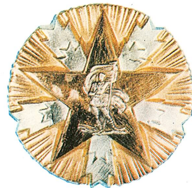
11. Orden zasluga za narod sa zlatnom zvijezdom

Orden Republike sa zlatnim vijencem dodjeljuje se pojedincima, organizacijama udruženog rada i društveno-političkim organizacijama i udruženjima za naročite zasluge na polju javne djelatnosti kojom se doprinosi opštem napretku zemlje.