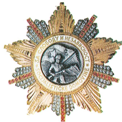
7. Orden ratne zastave

Orden jugoslovenske zvijezde sa lentom dodjeljuje se za naročite zasluge u razvijanju međunarodnih odnosa između Socijalističke Federativne Republike Jugoslavije i drugih zemalja, kao i za istaknute zasluge u razvijanju i učvršćivanju miroljubive saradnje i prijateljskih odnosa između Socijalističke Federativne Republike Jugoslavije i drugih država.