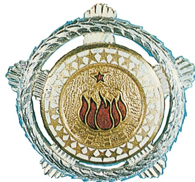
21. Orden bratstva i jedinstva sa srebrnim vijencem

Orden zasluga za narod sa srebrnim zracima dodjeljuje se za naročite zasluge stečene u borbi protiv neprijatelja za oslobođenje naše zemlje, za zasluge u izgradnji socijalizma i socijalističkih samoupravnih odnosa, za organizovanje i učvršćivanje opštenarodne odbrane, bezbjednosti i nezavisnosti zemlje, kao i za zasluge u oblasti privrede, nauke i kulture.