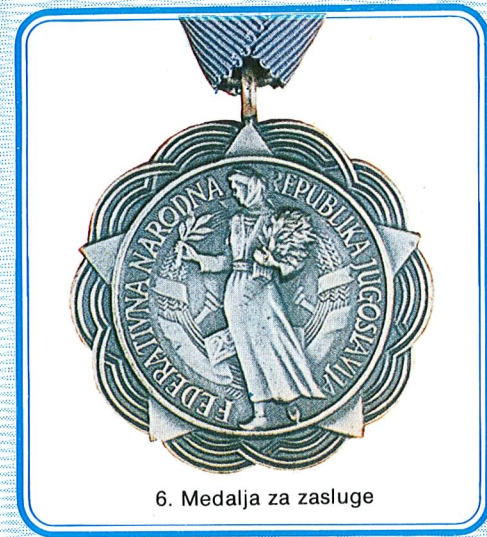
6. Medalja za zasluge

Medalja za vojničke vrline dodjeljuje se vojnicima i vojnim starješinama za naročito isticanje u poznavanju i vršenju vojničkih dužnosti i za primjerno vojničko držanje.