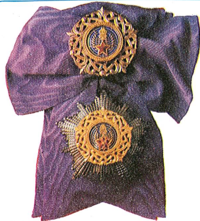
6. Orden jugoslovenske zvijezde sa lentom

Orden jugoslovenske zvijezde sa lentom dodjeljuje se za naročite zasluge u razvijanju međunarodnih odnosa između Socijalističke Federativne Republike Jugoslavije i drugih zemalja, kao i za istaknute zasluge u razvijanju i učvršćivanju miroljubive saradnje i prijateljskih odnosa između Socijalističke Federativne Republike Jugoslavije i drugih država.