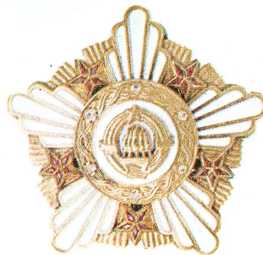
10. Orden Republike sa zlatnim vijencem

Orden Republike sa zlatnim vijencem dodjeljuje se pojedincima, organizacijama udruženog rada i društveno-političkim organizacijama i udruženjima za naročite zasluge na polju javne djelatnosti kojom se doprinosi opštem napretku zemlje.