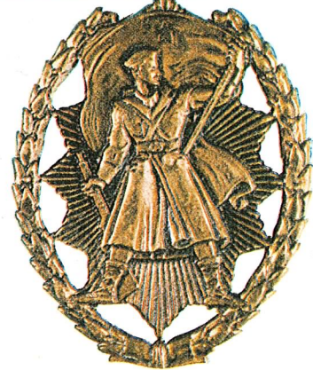
3. Orden narodnog heroja

Orden slobode dodjeljuje se za izvanredne uspjehe u rukovođenju i komandovanju najvećim vojnim jedinicama u ratu.