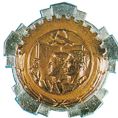
25. Orden rada sa zlatnim vijencem

Orden jugoslovenske zvijezde na ogrlici dodjeljuje se za naročite zasluge u razvijanju međunarodnih odnosa između Socijalističke Federativne Republike Jugoslavije i drugih zemalja, kao i za istaknute zasluge u razvijanju i učvršćivanju miroljubive saradnje i prijateljskih odnosa između Socijalističke Federativne Republike Jugoslavije i drugih država.