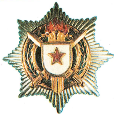
26. Orden za vojne zasluge sa zlatnim mačevima

Orden za vojne zasluge sa zlatnim mačevima dodjeljuje se rukovodiocima jedinica oružanih snaga SFRJ koji svojim primjerom i umješnošću u radu razvijaju u jedinici kojom rukovode stalan polet radi ostvarivanja postavljenih zadataka, ili koji su u jedinici ili ustanovi stvorili uslove za postizanje izuzetno dobrih uspjeha, ili koji se odlikuju takvim starješinskim i vojničkim osobinama da služe za primjer drugima.