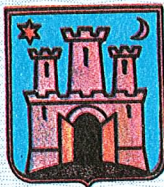
ZAGREB 16. IX 1975.