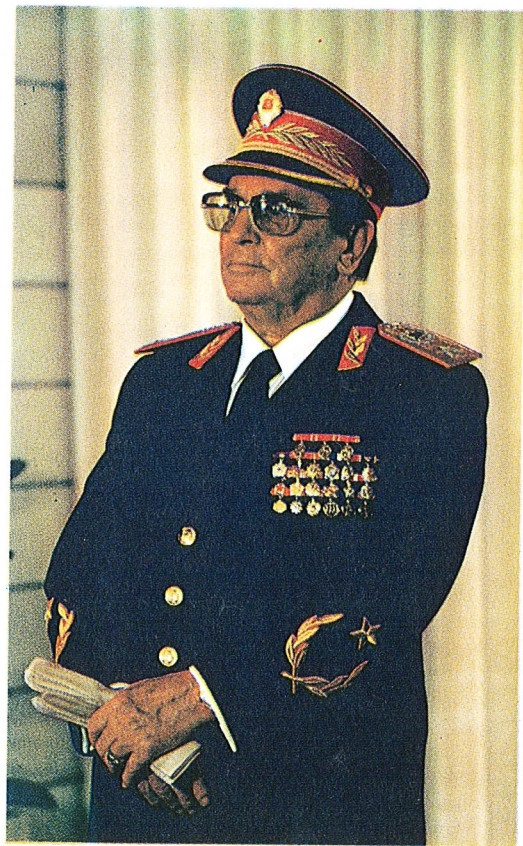
Vrhovni komandant Oružanih snaga Socijalističke Federativne Republike Jugoslavije Maršal Josip Broz - Tito