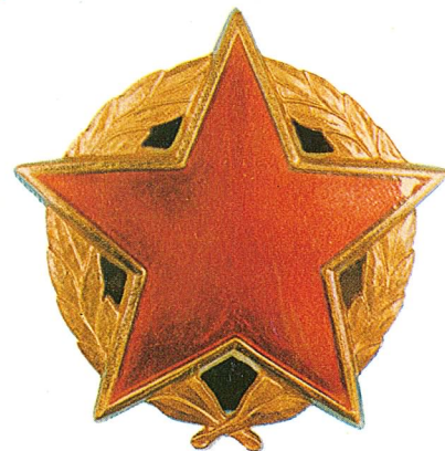
9. Orden partizanske zvijezde sa zlatnim vijencem

Orden jugoslovenske zastave sa lentom dodjeljuje se za zasluge u razvijanju i učvršćivanju miroljubive saradnje i prijateljskih odnosa između Socijalističke Federativne Republike Jugoslavije i drugih država, kao i za naročite zasluge u radu na razvijanju svijesti građana u borbi za nezavisnost zemlje.