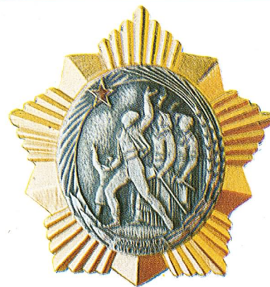
5. Orden narodnog oslobođenja

Orden junaka socijalističkog rada dodjeljuje se pojedincima, organizacijama udruženog rada, drugim organizacijama i jedinicama oružanih snaga Socijalističke Federativne Republike Jugoslavije koji izvrše izvanredne radne podvige ili pokažu druge izvanredne rezultate, i time steknu osobite zasluge za izgradnju samoupravnog socijalističkog društva, kao i za privredni, naučni i kulturni razvitak zemlje.