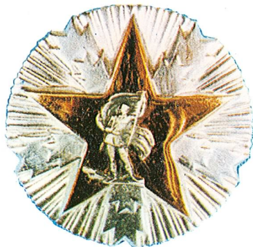
20. Orden zasluga za narod sa srebrnim zracima

Orden zasluga za narod sa srebrnim zracima dodjeljuje se za naročite zasluge stečene u borbi protiv neprijatelja za oslobođenje naše zemlje, za zasluge u izgradnji socijalizma i socijalističkih samoupravnih odnosa, za organizovanje i učvršćivanje opštenarodne odbrane, bezbjednosti i nezavisnosti zemlje, kao i za zasluge u oblasti privrede, nauke i kulture.