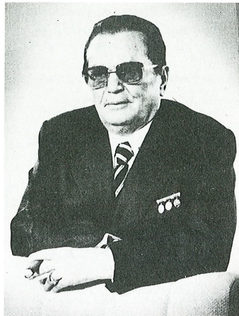
Predsjednik Socijalističke Federativne Republike Jugoslavije Josip Broz - Tito