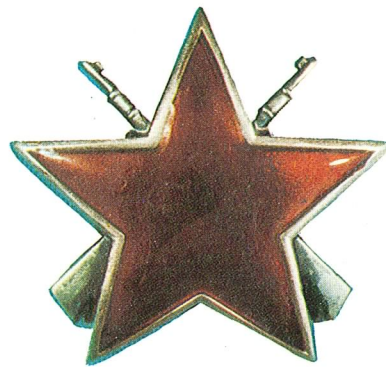
29. Orden partizanske zvijezde sa puškama

Orden jugoslovenske zastave sa zlatnom zvijezdom na ogrlici dodjeljuje se za zasluge u razvijanju i učvršćivanju miroljubive saradnje i prijateljskih odnosa između Socijalističke Federativne Republike Jugoslavije i drugih država, kao i za naročite zasluge u radu na razvijanju svijesti građana u borbi za nezavisnost zemlje.