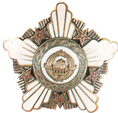
27. Orden Republike sa bronzanim vijencem

Ovaj orden dodjeljuje se i građanskim licima u jedinicama oružanih snaga SFRJ kao i pojedincima u organizacijama udruženog rada i drugim organizacijama, koji svojim primjerom i umješnošću u radu razvijaju stalan polet i postižu izvanredne rezultate u ostvarivanju zadataka od posebnog neposrednog značaja za narodnu odbranu.