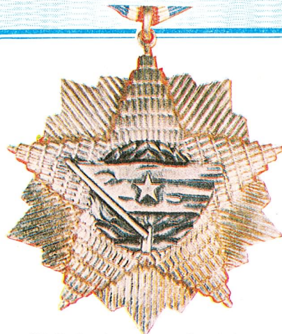
35. Orden jugoslovenske zastave sa srebrnom zvijezdom

Ovaj orden dodjeljuje se i građanskim licima u jedinicama oružanih snaga Socijalističke Federativne Republike Jugoslavije, kao i pojedincima u organizacijama udruženog rada i drugim organizacijama koji svojim primjerom i umješnošću u radu razvijaju stalan polet i postižu izvanredne rezultate u ostvarivanju zadataka od posebnog neposrednog značaja za narodnu odbranu.