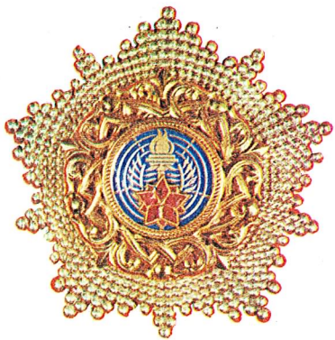
14. Orden jugoslovenske zvijezde sa zlatnim vijencem

Orden jugoslovenske zvijezde sa zlatnim vijencem dodjeljuje se za naročite zasluge u razvijanju međunarodnih odnosa između Socijalističke Federativne Republike Jugoslavije i drugih zemalja, kao i za istaknute zasluge u razvijanju i učvršćivanju miroljubive saradnje i prijateljskih odnosa između Socijalističke Federativne Republike Jugoslavije i drugih država.