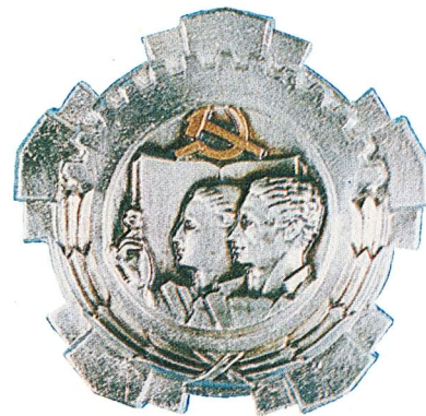
33. Orden rada sa srebrnim vijencem

Orden jugoslovenske zastave sa zlatnom zvijezdom dodjeljuje se za zasluge u razvijanju i učvršćivanju miroljubive saradnje i prijateljskih odnosa između Socijalističke Federativne Republike Jugoslavije i drugih država, kao i za naročite zasluge u radu na razvijanju svijesti građana u borbi za nezavisnost zemlje.