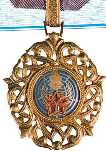
24. Orden jugoslovenske zvijezde na ogrlici

Orden jugoslovenske zvijezde na ogrlici dodjeljuje se za naročite zasluge u razvijanju međunarodnih odnosa između Socijalističke Federativne Republike Jugoslavije i drugih zemalja, kao i za istaknute zasluge u razvijanju i učvršćivanju miroljubive saradnje i prijateljskih odnosa između Socijalističke Federativne Republike Jugoslavije i drugih država.