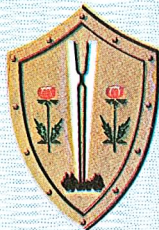
PRIŠTINA 7. V 1975.