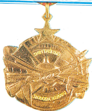
23. Orden za hrabrost

Orden Narodne armije sa zlatnom zvijezdom dodjeljuje se za narocite zasluge u izgradnji i jacanju oruzanih snaga Socijalističke Federativne Republike Jugoslavije ili za narocite uspjehe u rukovođenju jedinicama oruzanih snaga Socijalističke Federativne Republike Jugoslavije u njihovom učvršćivanju i osposobljavanju za odbranu nezavisnosti Socijalističke Federativne Republike Jugoslavije.