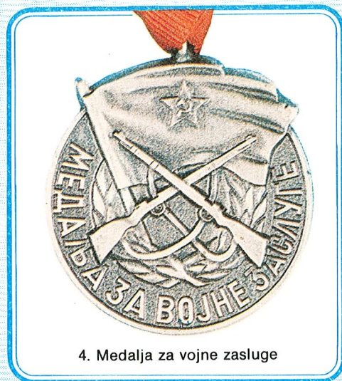
4. Medalja za vojne zasluge

Medalja rada dodjeljuje se za postignute primjerne uspjehe u radu i time stečene zasluge za napredak zemlje u privredi i drugim društvenim djelatnostima.