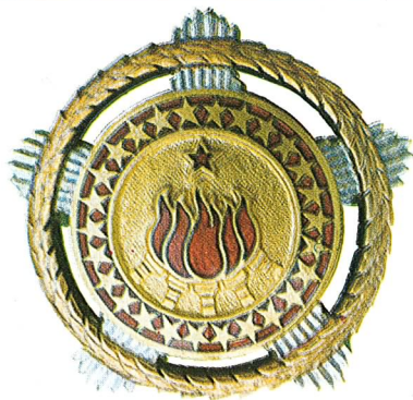
12. Orden bratstva i jedinstva sa zlatnim vijencem

Orden bratstva i jedinstva sa zlatnim vijencem dodjeljuje se za naročite zasluge u širenju bratstva među našim narodima i narodnostima, u stvaranju i razvijanju političkog i moralnog jedinstva naroda.