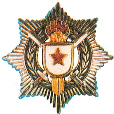
34. Orden za vojne zasluge sa srebrnim mačevima

Orden za vojne zasluge sa srebrnim mačevima dodjeljuje se rukovodiocima jedinica oružanih snaga SFRJ koji svojim primjerom i umješnošću u radu razvijaju u jedinici kojom rukovode stalan polet radi ostvarivanja postavljenih zadataka, ili koji su u jedinici ili ustanovi stvorili uslove za postizanje izuzetno dobrih uspjeha, ili koji se odlikuju takvim starješinskim i vojničkim osobinama da služe za primjer drugima.