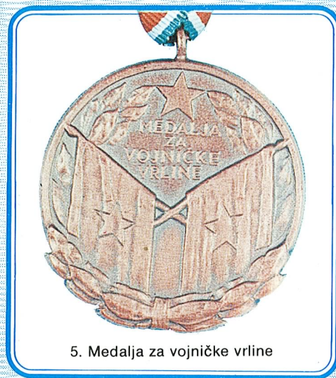
5. Medalja za vojničke vrline

Medalja za vojničke vrline dodjeljuje se vojnicima i vojnim starješinama za naročito isticanje u poznavanju i vršenju vojničkih dužnosti i za primjerno vojničko držanje.