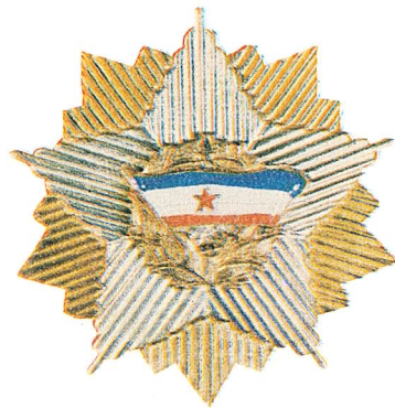
19. Orden jugoslovenske zastave sa zlatnim vijencem

Orden Republike sa srebrnim vijencem dodjeljuje se pojedincima, organizacijama udruženog rada i društveno-političkim organizacijama i udruženjima za naročite zasluge na polju javne djelatnosti kojom se doprinosi opštem napretku zemlje.