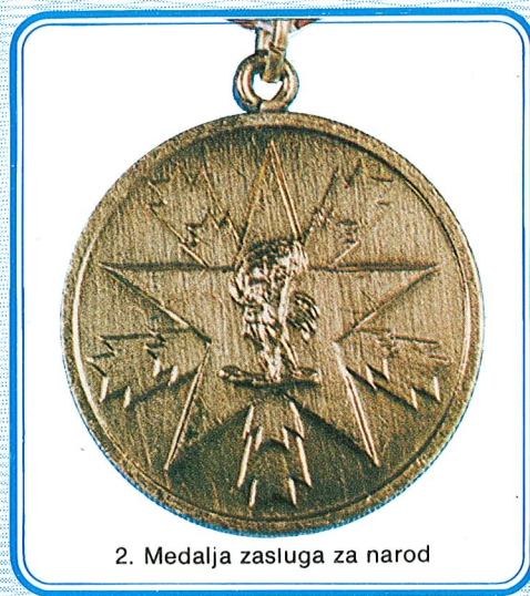
2. Medalja zasluga za narod

Ova medalja dodjeljuje se pojedincima koji u opasnim situacijama, spasavajući ljudske živote i materijalna dobra, izvrše djelo u kome je došla do izražaja lična hrabrost i samoprijegor.