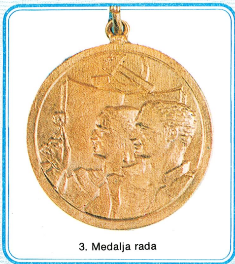
3. Medalja rada

Medalja rada dodjeljuje se za postignute primjerne uspjehe u radu i time stečene zasluge za napredak zemlje u privredi i drugim društvenim djelatnostima.