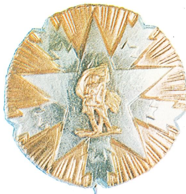
30. Orden zasluga za narod sa srebrnom zvijezdom

Orden zasluga za narod sa srebrnom zvijezdom dodjeljuje se za naročite zasluge stečene u borbi protiv neprijatelja za oslobođenje naše zemlje, za zasluge u izgradnji socijalizma i socijalističkih samoupravnih odnosa, za organizovanje i učvršćivanje opštenarodne odbrane, bezbjednosti i nezavisnosti zemlje, kao i za zasluge u oblasti privrede, nauke i kulture.