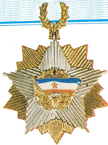
28. Orden jugoslovenske zastave sa zlatnom zvijezdom na ogrlici

Orden jugoslovenske zastave sa zlatnom zvijezdom na ogrlici dodjeljuje se za zasluge u razvijanju i učvršćivanju miroljubive saradnje i prijateljskih odnosa između Socijalističke Federativne Republike Jugoslavije i drugih država, kao i za naročite zasluge u radu na razvijanju svijesti građana u borbi za nezavisnost zemlje.