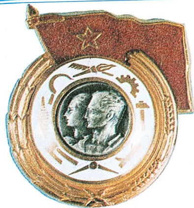
15. Orden rada sa crvenom zastavom

Orden jugoslovenske zvijezde sa zlatnim vijencem dodjeljuje se za naročite zasluge u razvijanju međunarodnih odnosa između Socijalističke Federativne Republike Jugoslavije i drugih zemalja, kao i za istaknute zasluge u razvijanju i učvršćivanju miroljubive saradnje i prijateljskih odnosa između Socijalističke Federativne Republike Jugoslavije i drugih država.