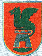
LJUBLJANA 24. IV 1970.