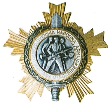
13. Orden Narodne armije sa lovorovim vijencem

Orden bratstva i jedinstva sa zlatnim vijencem dodjeljuje se za naročite zasluge u širenju bratstva među našim narodima i narodnostima, u stvaranju i razvijanju političkog i moralnog jedinstva naroda.