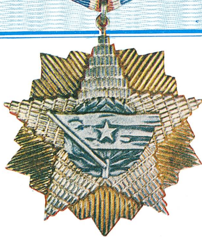
32. Orden jugoslovenske zastave sa zlatnom zvijezdom

Orden jugoslovenske zastave sa zlatnom zvijezdom dodjeljuje se za zasluge u razvijanju i učvršćivanju miroljubive saradnje i prijateljskih odnosa između Socijalističke Federativne Republike Jugoslavije i drugih država, kao i za naročite zasluge u radu na razvijanju svijesti građana u borbi za nezavisnost zemlje.