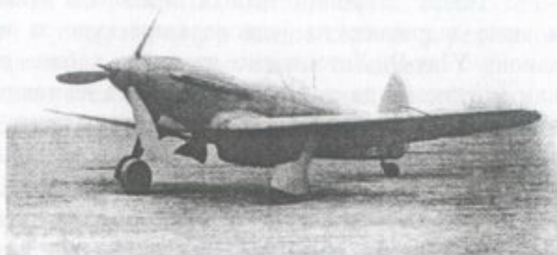
Борбени авион Јак-9. Самостално га полетео 6. јуна 1947. на аеродрому Алибунар