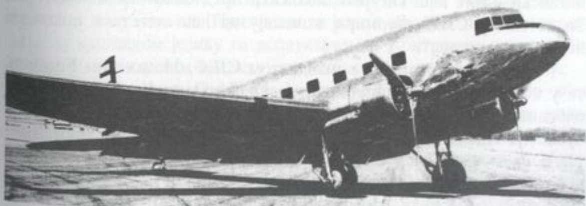
Авион ДЦ-3, на којем сам остварио највећи налет

Командант једног дана позва мене и Ђуровића да обиђемо „Возни парк“. Ђуровић и ја се смејемо „возном парку“ којег је сачињавало око 20 авиона Цет провост, који је био мало спорији од нашег Јастреба али диван авион са седиштима једно поред другог, затим 5-6 Бивера, 8-10 хеликоптера, три исправна и два ДЦ-3 на регламентним радовима. Технички састав су чинили Енглези изузев помоћног особља. Од летачког састава имали су два пилота. Оба су били копилоти на ДЦ-3. Они нису хтели да лете Цет провоста јер је био борбени авион. Имали смо десетак питомаца који су код Енглеза почели обуку на Цет провосту. Поред њих створи се један Египћанин који дође са чином мајора и потврдом да је пилот на Ил-14. Он је гледао на сваки начин да се наметне Јеменцима за команданта РВ пошто је тобоже пилот. Био је веома мрачан тип и шарлатан.