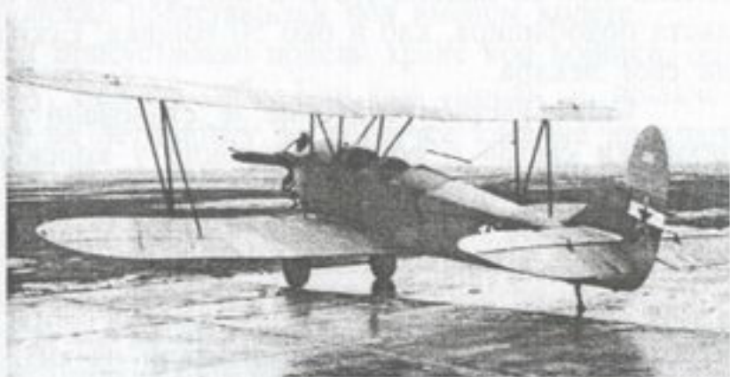
По-2, почетни школски авион. Самостално га полетео 22. маја 1946. године