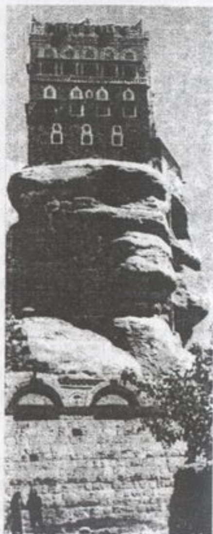
„Чардак спаса“ на чуки у Јемени

Од беса викнух: „О Боже, луда ли човека“... и окренух главу лево у знак протеста. Кроз пукотину у облаку, угледах кулу на врху чуке која је била на око два минута лета до Таиза. Био сам спасен заједно са свим путницима и Цохаром, јер сам сад знао моју позицију. Цохар бесни и наређује да идем доле. Замолих га да ме пусти да лет завршим по моме прорачуну. Знајући терен перфектно, пресрећан и