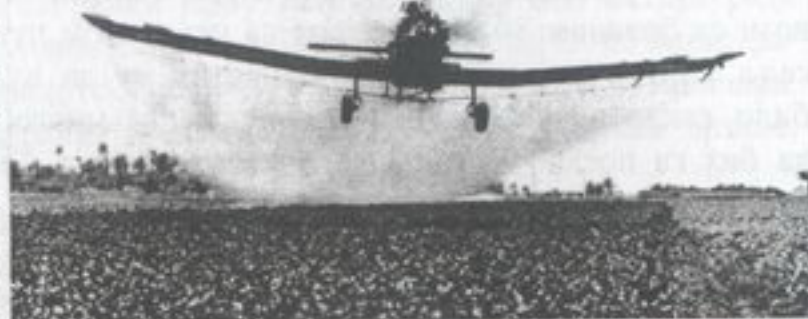
Пољопривредни авион „Дромадер“ врши запрашивање

ше од Утве-65 и Чмелака. Ми смо летели од изласка до заласка сунца. Радници-утоваривачи ђубрива би нас псовали јер су једва стизали да нас утоваре. Просечно смо дневно бацили око 70.000 килограма ђубрива, а једног месеца смо бацили 1,600.000 килограма. Ми-слим да смо били рекордери у СФРЈ, али ми томе нисмо придавали никакав значај.