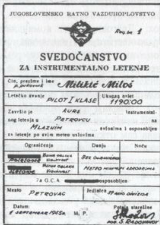
Сведочанство за ИФР летење

Радованов сав срећан нам честита. Узех начелникову књижицу и написах да је у току лета два пута пао у неправилан положај и да не уме да вади авион из неправилног положаја. Зато му за-