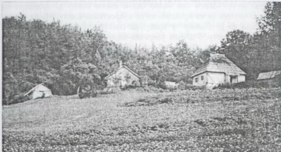
Кућа Миликића на Коси Божићића, 1981.