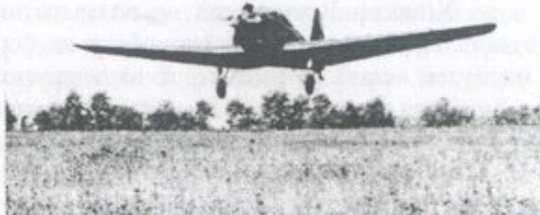
Ут-2, прелазни школски авион. Самостално га полетео 15. августа 1946. године у Омољци